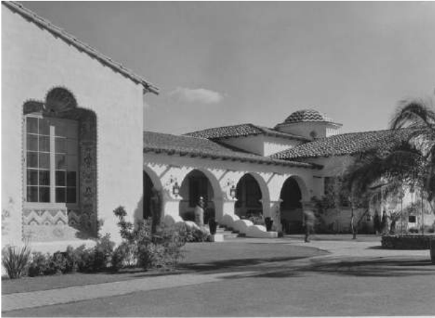
Área de acceso al Casino de Agua Caliente, que incluía a la derecha el llamado “Pozo de los Deseos”.

que trajeron los frailes franciscanos: tornos para madera, sierras braceras y cuchillas para los cepillos que se empleaban en los rebajes y resagues. Esas rudimentarias pero eficientes herramientas hicieron posibles paradigmáticas obras en madera, que serían repetidas una y otra vez en el futuro.