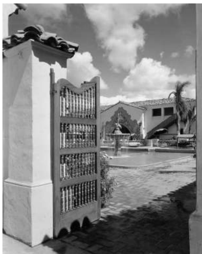
Cancel de ingreso a la alberca de Agua Caliente. (Colección de José Saldaña Rico.)

lo que fue uno de los propulsores del llamado estilo misión, que consistía en recrear los lenguajes renacentistas del siglo dieciséis novohispano, como lo hizo con las conocidísimas sillas fraileras. Ese mismo tipo de asientos simplificados, resistentes y funcionales inspirarían los muebles estilo misión, que elaboraban en el estado de Nueva York varias compañías, entre ellas la de los hermanos Stickley, así como los que después se manufacturaron en Tijuana, a finales del siglo veinte y principios del veintiuno, en la fábrica Douglas Furniture. En esta empresa se rediseñaron con algunas variantes, como el reposed, que incluyen herrajes y dispositivos que permiten el movimiento. Lamentablemente, en la actualidad la compañía los fabrica en China, muy lejos del ámbito que los originó (Bejarano, 2007:93).