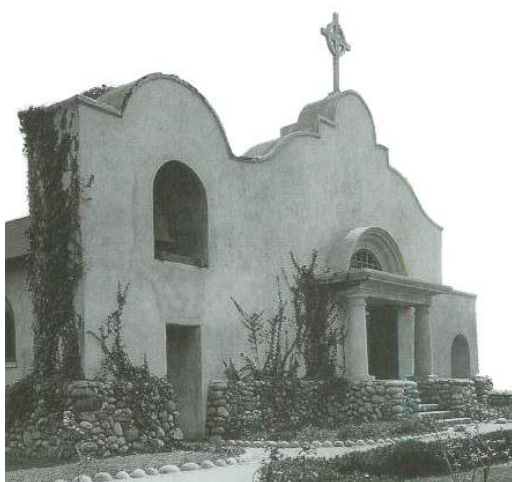
Capilla Episcopal de Saint James, en La Jolla, California, diseñada por Irving Gill en 1908.

español, en ocasión de la feria que celebraba en 1915 la apertura del Canal de Panamá, todo ello ubicado en el hoy famoso Balboa Park. Allí permanecen esas obras, algunas con detalles un tanto escenográficos en las fachadas, sin dejar de reconocer su intento de preservar elementos de la arquitectura Spanish Colonial, como denominaron los críticos norteamericanos a principios del siglo veinte a la suma ecléctica de las formas renacentistas y barrocas. 12 Sería hasta los años cincuenta cuando la historiadora de la arquitectura Esther McCoy, en su obra Five California