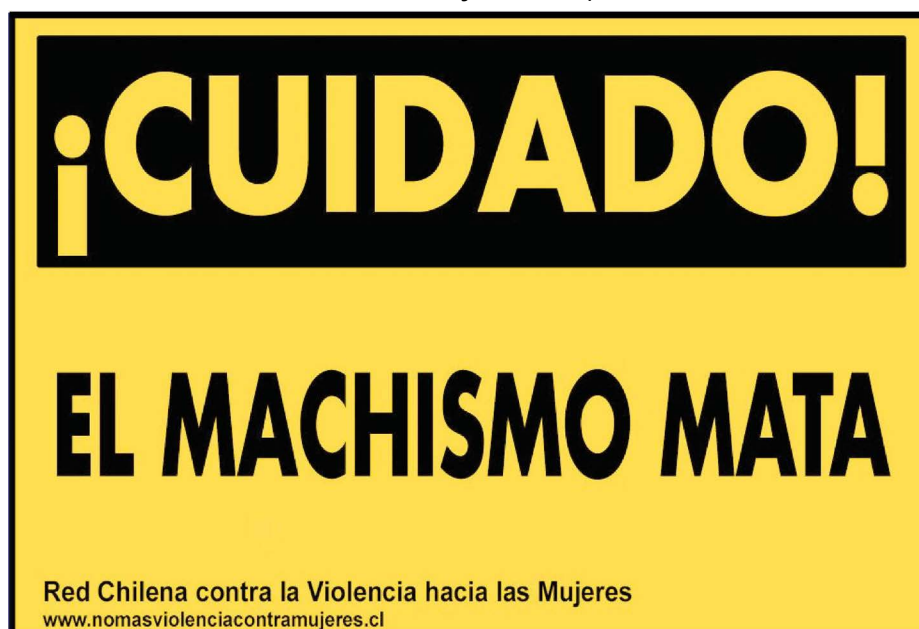
Figura 2. Afiche contra la violencia hacia las mujeres, campaña comunicacional de 2026.

Nota: Véase más información en https://www.nomasviolenciacontramujeres.cl/cuidad-el-machismo-mata/