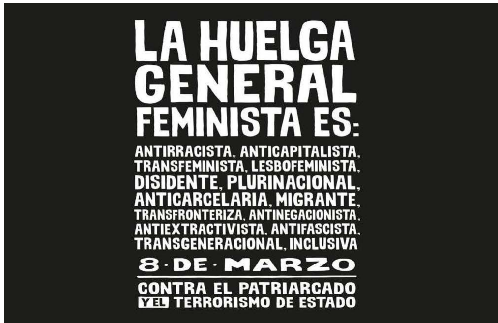
Figura 1. Afiche de la marcha del 8 de marzo de 2021.

Nota: Disponible en https://www.instagram.com/p/CLc4MzTgUGH?igsh=MTdiMmZidzZ3bGozZw%3D%3D