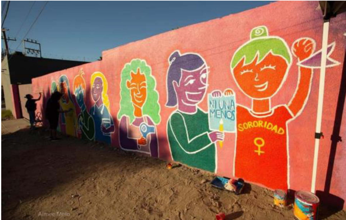
Figura 2. La presencia de las mujeres en el espacio público

Nota: Mural realizado por Las Themis en Cemujer, Tijuana, como parte de una serie de intervenciones que reivindican la presencia de las mujeres en el espacio público. La obra incorpora elementos visuales que evocan el cuidado, la fuerza colectiva y la esperanza. Fuente: Aimee Melo / Las Themis, 17 de noviembre de 2020.