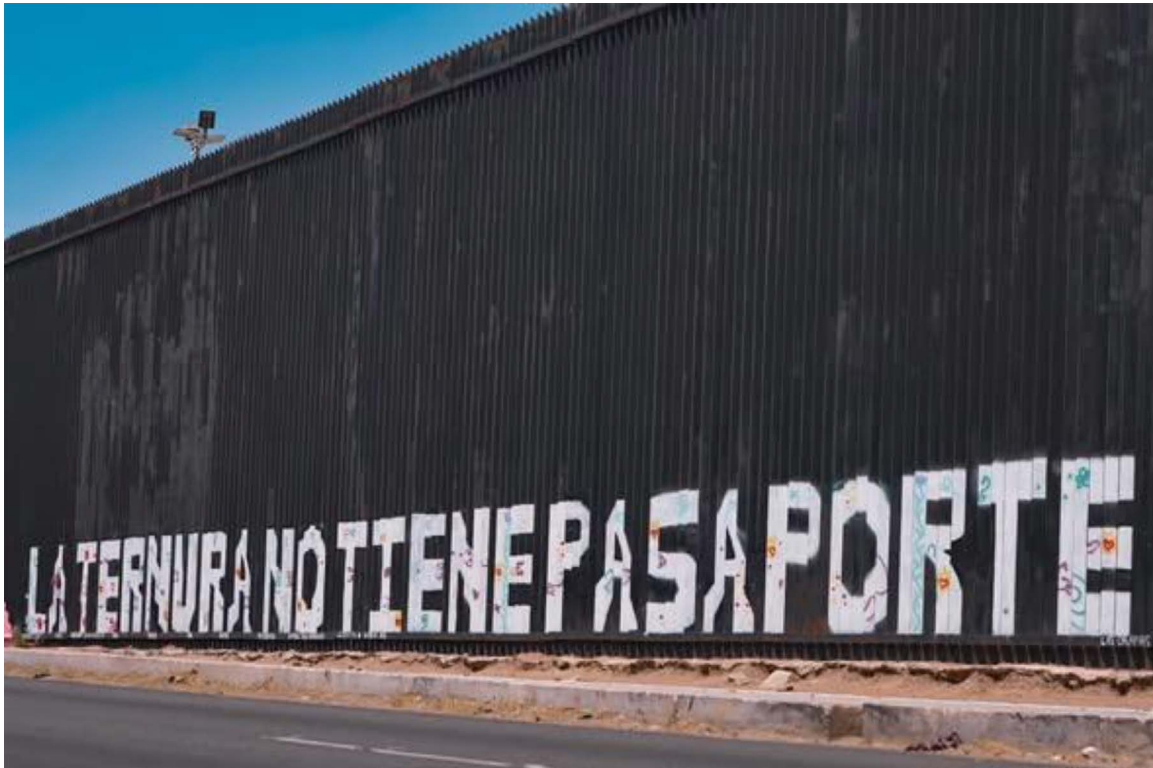
Figura 6. Muro fronterizo entre Mexicali y Calexico

Nota: Intervención mural de la Colectiva Las Calafías en el muro fronterizo entre Mexicali y Calexico, con el eslogan “La ternura no tiene pasaporte”.