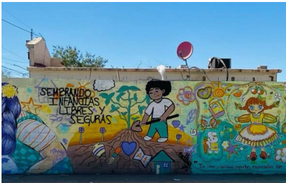
Figura 5. Mural colectivo realizado por participantes infantiles de la comunidad Los Santorales

Nota: Este mural colectivo se realizó como parte del proyecto “ Alzar las Muras con las Niñeces ”, impulsado por Las Calafias y apoyado por el PACMYC. La frase “ Sembrando infancias libres y seguras ” expresa el enfoque comunitario y afectivo de la intervención. Fuente: Las Calafias, 6 de abril de 2025.