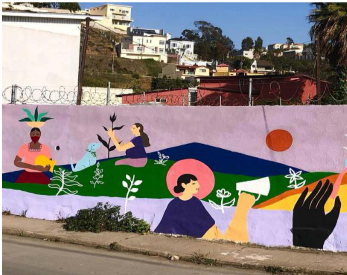
Figura 3. Mural realizado en colaboración entre la Colectiva Maremoto y el Colectivo Siempre Vivas

Nota: En el mural se articulan símbolos de resistencia feminista y cuidado comunitario.