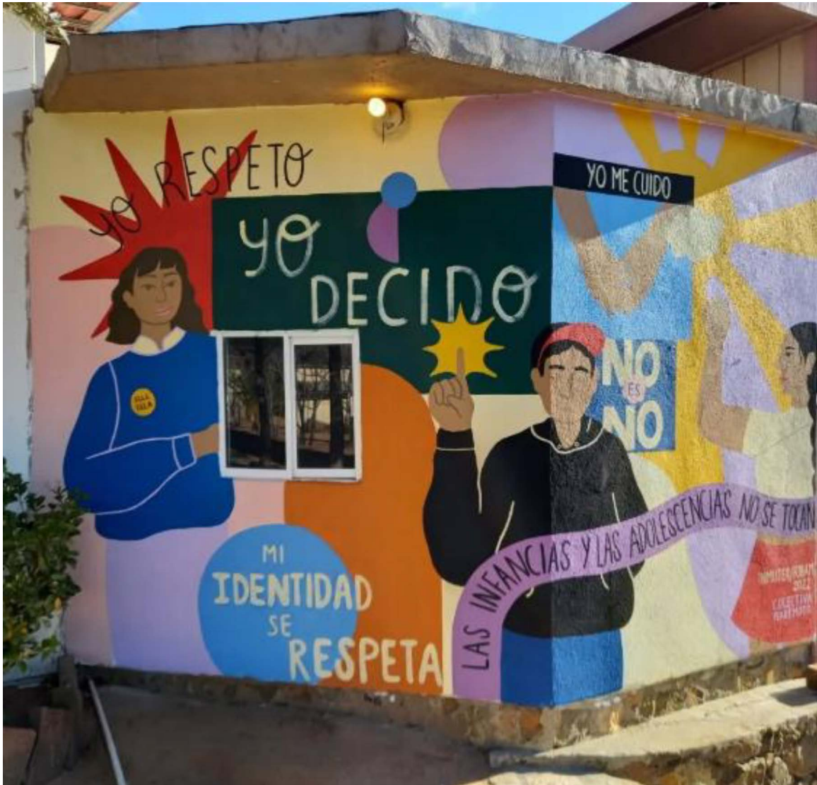
Figura 4. Mural colectivo Yo respeto

Nota: Realizado por la Colectiva Maremoto en la preparatoria Cecytec de Ensenada. La obra integra consignas que promueven el respeto a la diversidad, la autonomía y la protección de las infancias desde una perspectiva comunitaria.